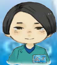
武沢医療ソーシャルワーカー