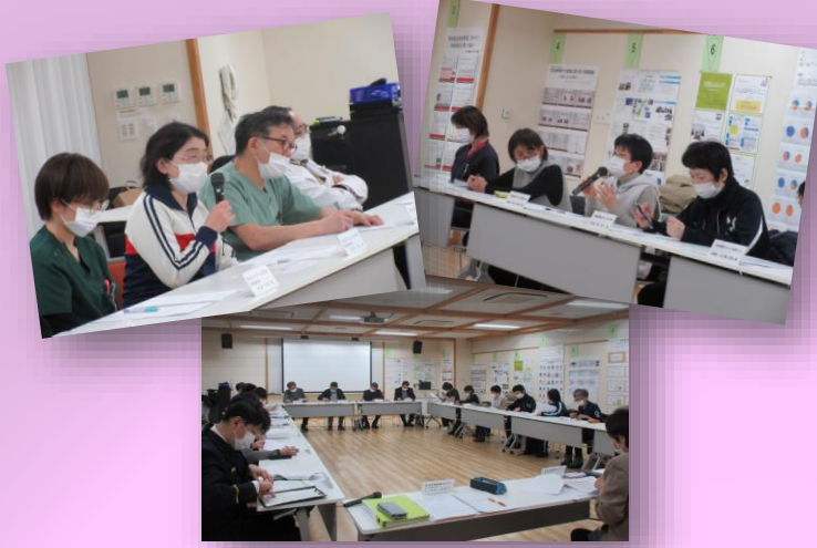
看取り支援制度関係者会議 R6.3.1